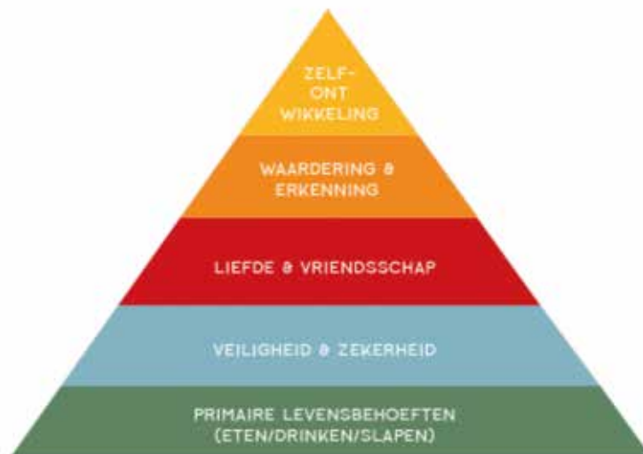
Behoeftepiramide van Maslow

Als we kijken naar de in 1943 door de Amerikaanse psycholoog Abraham Maslow (1908 - 1970) gepubliceerde piramide met daarin een hiërarchische ordening van behoeften, voorziet het Forum op geen enkele wijze in de basisbehoefte van de mens. Volgens de theorie van Maslov zou de mens pas streven naar bevrediging van behoeften hoger in de hiërarchie als de lager geplaatste behoeften bevredigd zijn.